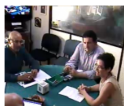
A Radio Cammarata il Sindaco di Cefalù